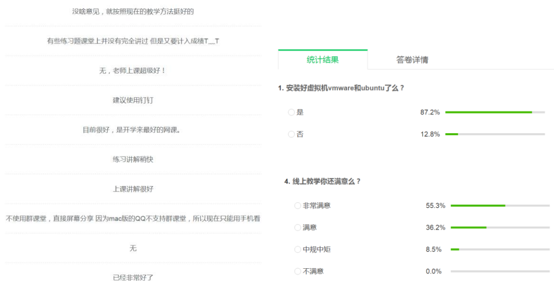
图 4 部分问卷题目统计

第一周课程结束后，利用慕课堂发放问卷调查，及时了解学生情况，调整教学方式。47位学生全部参加调查，反馈 59.6% 的学生线上学习非常流畅，40.4% 的学生偶有卡顿；93.6% 用电脑学习，其他学生也有平板电脑支持，基本有两台或以上设备参与学习，所有学生都具有在线学习条件。60% 左右的学生看了视频，学生普遍更喜欢老师直播授课，但对复习有很大帮助；80.9% 学生通过第一周学习了解课程的主要内容，比前以往线下教学要高。91.5% 的学生对线上教学非常满意或满意，高于学校 71% 的平均值，没有同学表示不满意；学生纷纷留言表达意见和需求，在第二周上课中及时调整课程平台、上课节奏、练习时间和内容。针对要安装的软件的调研显示，仅仅一个周末，87.2% 的学生就完成了软件安装，仅有 6 人未完成，也明显好于线下教学，如图 4。