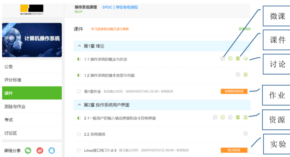
图 2 中国大学 MOOC 平台上学习页面

开课之前，完善各类学习资源。以中国大学 MOOC 平台为支撑，建设 SPOC 课程，在原有拍摄知识点微课视频的基础上，针对疫情期间学生自主学习需求，拍摄引导式、实践环节的微课，完善各类教学资源，既保证了教学不因网络条件而卡顿，又为课堂教学中的讨论做好前期准备，加强实验环节的指导，如图 2。